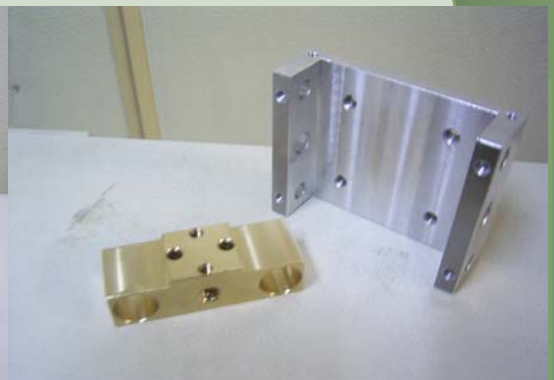
PIEZAS DE FRESADO