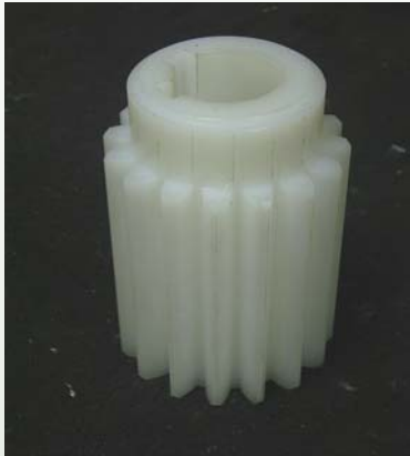
ENGRANAJE RECTO NYLON